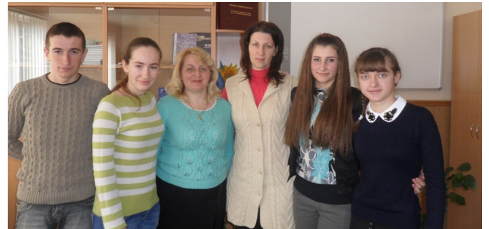
Команда Василівської ЗОШ I-III ступенів «Без ГМО» –переможці I етапу IV Чемпіонату області з основ підприємництва "Крок до бізнесу".