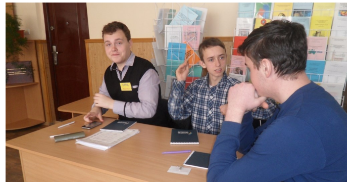
У розпалі гри. Команда Божківського НВК «ЛиПіПо».