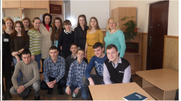
Учасники фінальної гри I етапу IV Чемпіонату області з основ підприємництва "Крок до бізнесу".

Особливістю такого конкурсу є категорія учасників – виключно учні випускних класів. Через зовсім невеликий проміжок часу їм доведеться обирати свою стежину в дорослому житті. Тож побажаємо успіху тим, хто вже зробив свій перший крок до бізнесу.