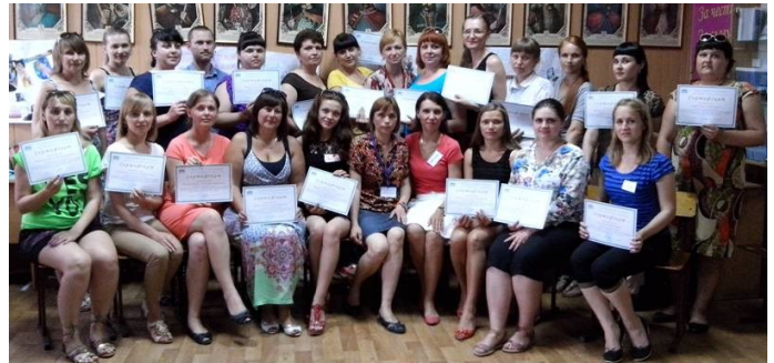
Учасники обласного навчального тренінгу «Організація роботи працівника психологічної служби з питань запобігання та профілактики торгівлі людьми»

«Безпека та допомога», «Можливості протидії проблемі торгівлі людьми за допомогою просвітницької діяльності методом «рівний-рівному», «Тренінг як одна з форм організації просвітницької роботи». Всі учасники отримали сертифікати та були забезпечені відповідними темі матеріалами у електронному вигляді.