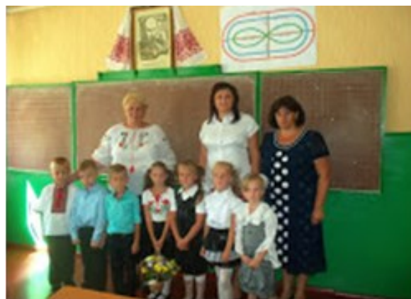
Перший урок для учнів 1-го класу Вацівської ЗОШ I-II ст. ім. В. Тюріна

Для учнів 1-4 класів проведені бесіди, години спілкування, розмови у дружньому колі «Чому наш прапор жовто-блакитний», «Про що розповідає наш герб», «Національні символи України», «Я – маленький громадянин держави», «Ми – українці – єдина сім'я», «Батьківщина, рід, родина», «Славені українці», «Вона на світі одна-єдина, наша Україна», «Видатні українці», «Ще не вмерла України і слава, і воля...», «Козацькому роду нема переводу», «Мово рідна, слово рідне...».