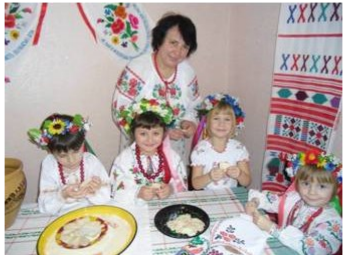
«Вірні друзі на квітковім лузі»