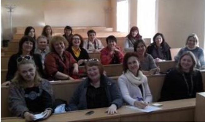
Організаційні збори секції системної Української спілки психотерапевтів