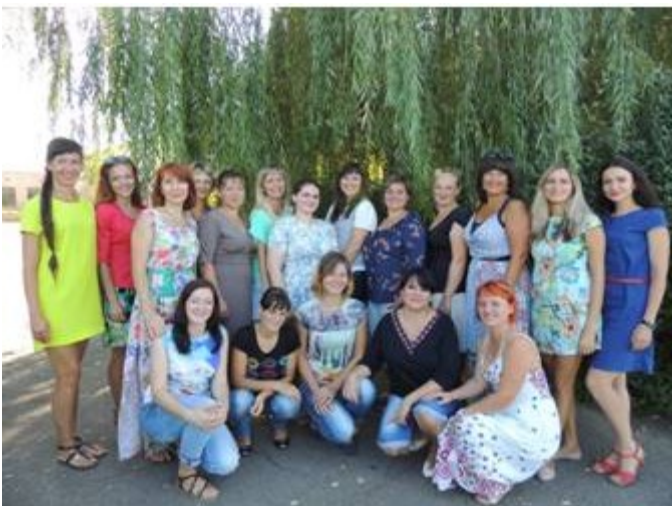
Психологічна служба Полтавського району

На нараді розглядався такий напрямок роботи, як експертиза психологічного інструментарію . Відповідно до наказу МОН України від 20.04.2001 р. № 330 «Про затвердження Положення про експертизу психологічного і соціологічного інструментарію, що застосовується в навчальних закладах Міністерства освіти і науки України» та наказу Департаменту освіти і науки Полтавської ОДА «Про організаційні заходи щодо здійснення експертизи психологічного та соціологічного інструментарію» від 22.03.2013 № 111, практичні психологи і соціальні педагоги у своїй роботі можуть користуватися тільки тими діагностичними та корекційними методиками, розвивальними програмами, які пройшли експертизу. Для якісного проведення діагностичної роботи в закладі освіти обов'язковим є проходження психологічної експертизи всіх методик, тестів, анкет, програм.