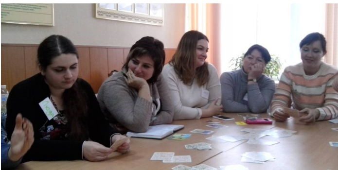
Учасники навчального семінару по МАК

Проведено опитування учасників наради для планування подальшої роботи психологічної служби, систематизовано запити на другий семестр.