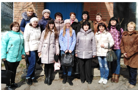
Вчителі предметів освітньої галузі «Мистецтво» на засіданні РМО в Супрунівському НВК

Після РМО відбулося чергове засідання творчої групи вчителів музичного мистецтва, на якому учасники представили свої напрацювання з теми «Пізнання класичної музики через твори образотворчого мистецтва».