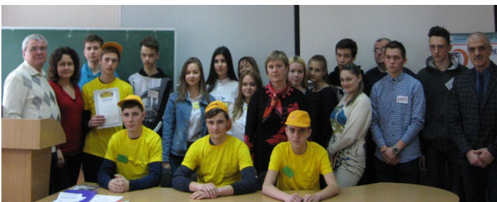
Учасники фінальної гри VII Чемпіонату області з основ підприємництва "Крок до бізнесу"

Дякуючи викладачам вузу, учасники змагань мали змогу познайомитися з університетом, умовами нав-