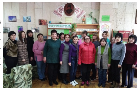
Учасники еколого-поетичної години