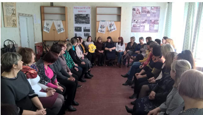
Приєм "Ранкове коло"