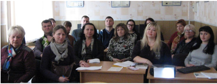
Засідання РМО вчителів географії в Абазівській ЗОШ І-ІІІ ст.

Удосконалення загальної середньої освіти спрямоване на переорієнтацію процесу навчання, на розвиток особистості учня, навчання його самостійно оволодівати новими знаннями. Новий етап у розвитку шкільної освіти пов'язаний з упровадженням компетентнісного підходу до формування змісту та організації навчального процесу, що вимагає певного підвищення професійної майстерності вчителя, дозброєння його новими знаннями, сучасними компетенціями, методами і технологіями, які б дозволили вчителю перебудувати освітній процес відповідно до нових вимог і підходів.