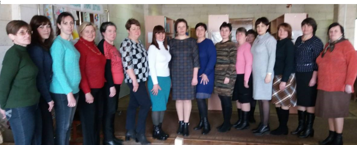
На засіданні РМО вчителів української мови та літератури Полтавського району