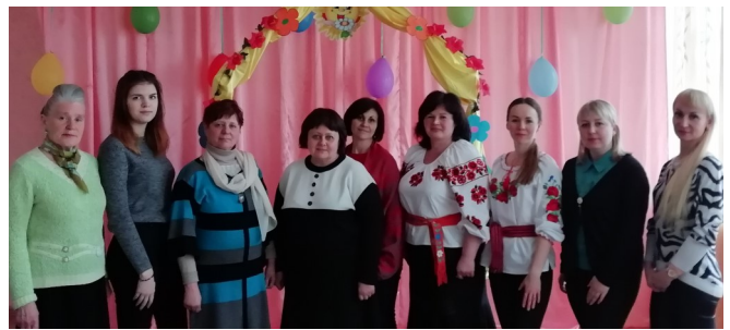
РМО музичних керівників ЗДО Полтавського району

22.03.2019 року в дошкільному підрозділі "Барвінок" Бричківського НВК відбулося планове засідання районного методичного об'єднання музичних керівників ЗДО Полтавського району з теми "Розвиток відчуття ритму у дітей дошкільного віку під час проведення музичних занять".