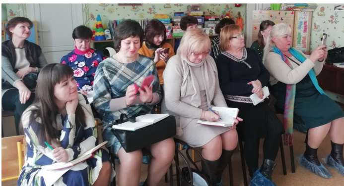
На засіданні РМО керівників ЗДО Полтавського району

27.03.2019 року в Абазівському ЗДО "Світанок" відбулося засідання районного методичного об'єднання керівників закладів дошкільної освіти Полтавського району на тему "Здоров'язберезувальні технології в дошкільному закладі".