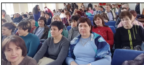
Під час засідання Круглого столу

12 березня 2019 року вчителі Полтавського району стали учасниками засідання круглого столу - зустрічі з авторами підручників з хімії та біології. У рамках зібрання доктор педагогічних наук, професор Леонт'єв Д.В. ознайомив учителів з сучасною класифікацією, прочитавши лекцію "Токсономічна революція - систематика і не тільки".