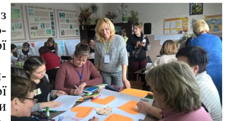
Під час тренінгового заняття

Протягом наступних двох місяців учителів очікує насичена, цікава програма та різноманітні командні форми роботи, які допоможуть не загубитися на власному шляху до професійного й особистісного зростання і оволодіти навичками, необхідними для сучасного вчителя Нової української школи.