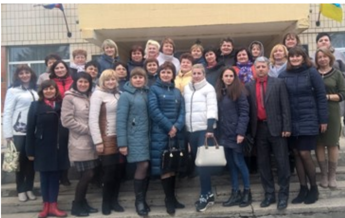
Учителі початкових класів у Трудолюбівській ЗОШ І-ІІІ ст.

26 березня 2019 року вчителі початкових класів Полтавського району відвідали Трудолюбівську ЗОШ І-ІІІ ступенів Миргородського району. Це єдина в Україні школа, яка перемогла у конкурсі на участь в українсько-фінському проекті «Змінитися за 7 днів».