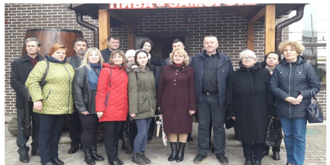
Біля місцевого етнографічного музею пивоваріння

Отримавши безліч позитивних емоцій, географи вирішили і надалі вивчати найцікавіші місця рідного краю.