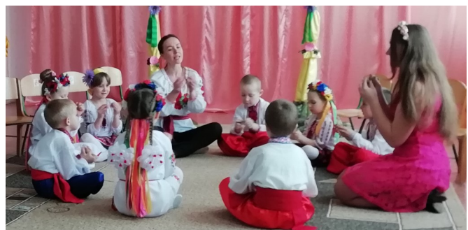
Виконання ритмічних вправ вихованцями "Барвінку"

настрій на весь день. На занятті були використані цікаві сучасні прийоми, ігри, музично-ритмічні вправи, що безпосередньо буде корисним у використанні для музичного виховання дітей закладів дошкільної освіти, адже саме музичне виховання - ключ до повноцінного, гармонійного розвитку дошкільнят.