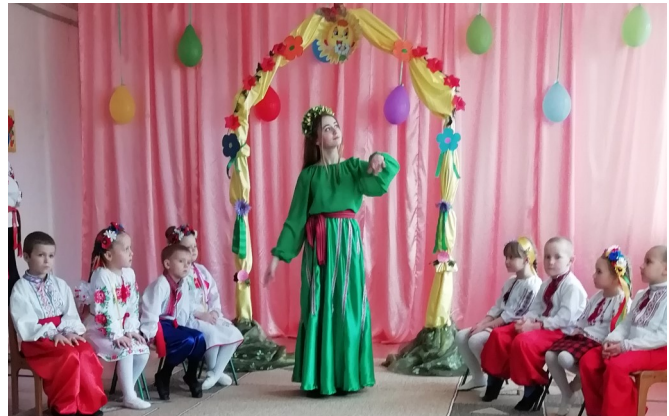
Музичне заняття у ДП "Барвінок" Бричківського НВК

Музичний керівник закладу разом з дружним колективом показали чудове заняття з вихованцями, від якого всі отримали задоволення та гарний