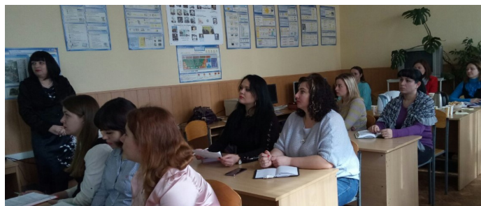
Учасники семінару «Методи роботи з дітьми з різними нозологіями»

У НУШ в пріоритеті цінності дитиноцентризму, тож відтепер ітиметься про вивчення динаміки розвитку особистості, її потенційних можливостей. Акценти змінені: не «знайти ваду», а «розкрити можливості».