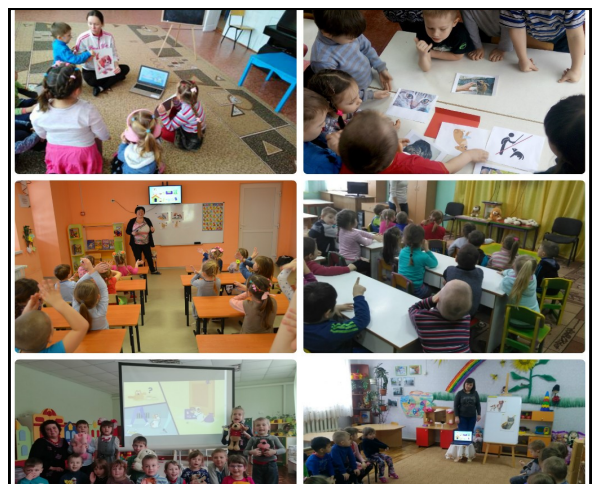
Всеукраїнське заняття доброти в дошкільних закладах Полтавського району

За організовану та проведену роботу, творчий підхід, педагогічну майстерність щира подяка педагогам дошкільних закладів Полтавського району, всім учасникам Всеукраїнського заняття!