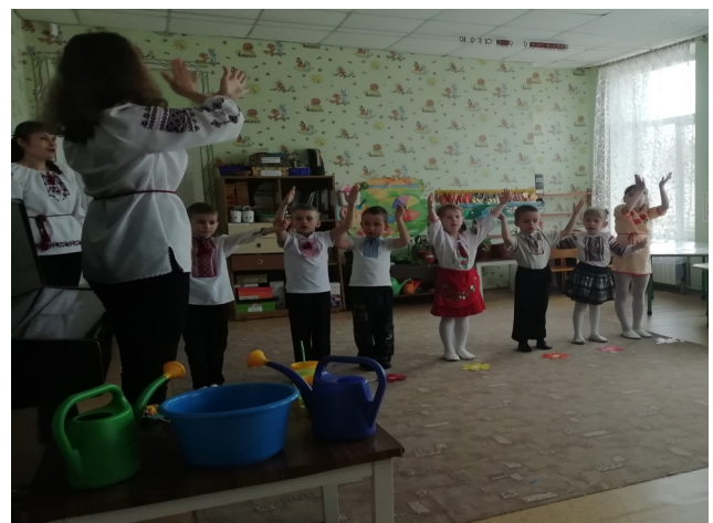
Фрагмент заняття з використанням здоров'язберезувальних технологій