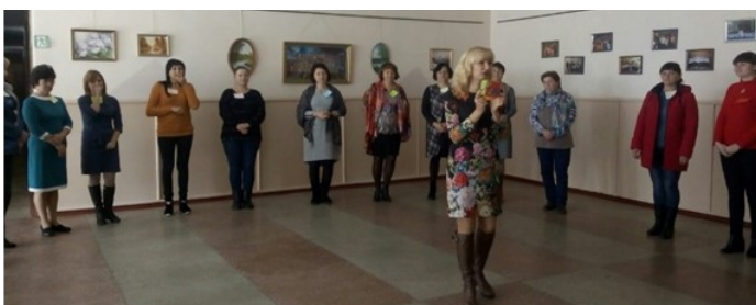
Учасники тренінгу під час виконання практичних вправ

Дякуємо усім учасникам за захоплюючу гру та можливість навчання по-іншому разом.