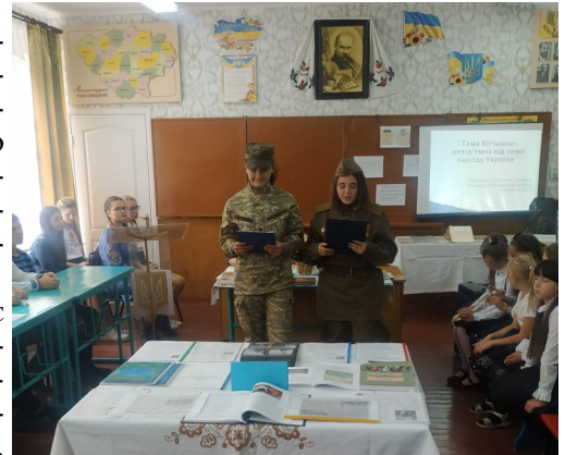
Виступ учасників пошукового загону «Чураївна»

Різноманітність підходів до вивчення історії рідного краю, літературної спадщини письменників-земляків дає змогу виховувати в учнів патріотичні почуття, формувати