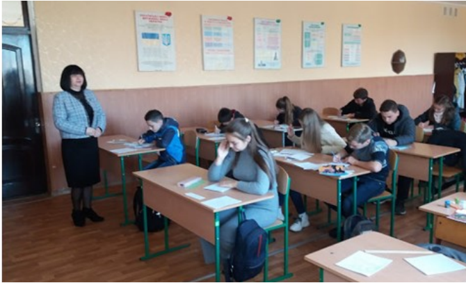
У ході проведення математичних змагань

30 жовтня 2019 року на базі Розсошенської гімназії було проведено районний етап XXIII обласних математичних змагань імені М.В.Остроградського. Участь у змаганнях сприяє популяризації математичних ідей, вихованню у молодого покоління поваги до історії математики, виявленню творчо обдарованої молоді та розвитку її інтелектуальних здібностей.