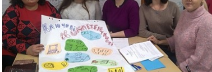
Робота в групі

У Терешківській ЗОШ І-ІІІ ст. почали працювати 38 вчителів початкових класів Полтавського району, Заворсклянської, Коломацької, Мачухівської, Терешківської, Щербанівської ОТГ.