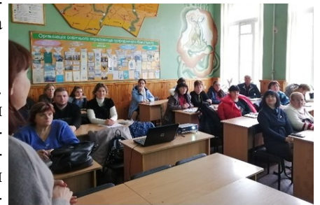
У ході засідання РМО

1 листопада 2019 р. на природничий факультет ПНПУ імені В. Короленка для проведення методичного об'єднання завітали вчителі Полтавського району.