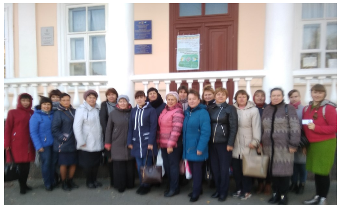
Вчителі Полтавського району біля музею І. П. Котляревського