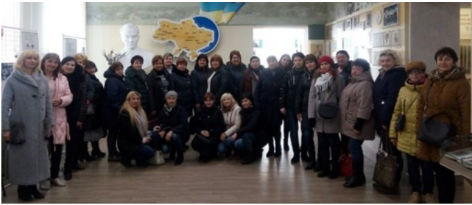
Вчителі Полтавського району в музеї В. О. Сухомлинського

Без віри в дитину, без довір'я до неї вся педагогічна премудрість, усі методи і прийоми навчання й виховання руйнуються як картковий будиночок В.О.Сухомлинський