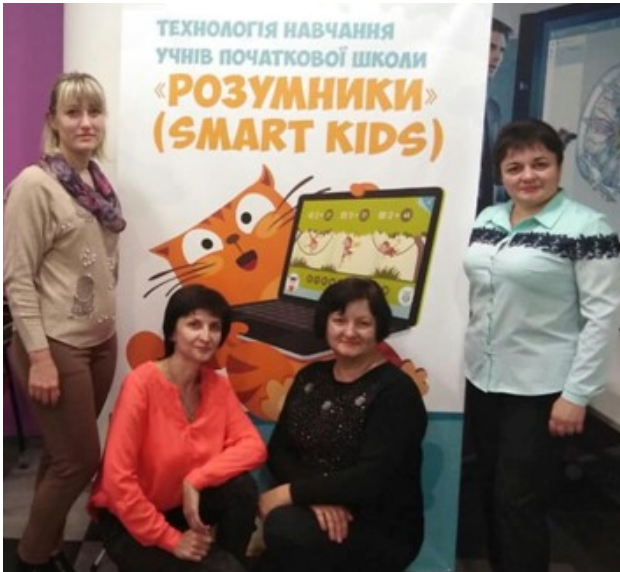
Творча група вчителів початкових класів

Школа сьогодні відчуває потребу у вчителів, який постійно прагне до творчого пошуку, має навички дослідної, експериментальної діяльності, вивчення, узагальнення, впровадження перспективного досвіду, високого рівня інформаційної культури, вміє інтерпретувати новий зміст освіти в методику навчання і виховання, здійснювати аналіз результатів творчої діяльності як своєї власної, так і педагогічного та учнівського колективів.