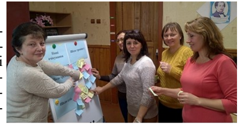
Рефлексія учасників тренінгу