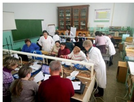
Практичні заняття з використанням цифрової лабораторії «Ейнштейн»

У ході зустрічі учасники заходу обмінялися думками та враженнями, окреслили перспективні шляхи подальшої співпраці.