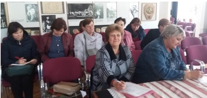
Члени творчої групи вчителів математики під час обговорення теми.

Працівниками музею для вчителів творчої групи була проведена екскурсія, присвячена 250 річчю від дня народження видатного українського письменника, поета, драматурга, засновника нової української літератури та громадського діяча Івана Петровича Котляревського. Таким чином педагоги змогли долучитися до вшанування пам’яті письменника, збагатили власні знання, провели час у приємній творчій атмосфері.