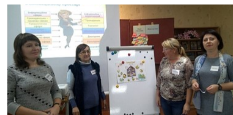
Виконання спільного проєкту

Під час виконання інтерактивних вправ учасники усвідомлювали нові професійні ролі вчителя, розкривали коло основних понять і термінів, виконували вправи, завдання, інформаційні повідомлення, ігри, дискусії на набуття необхідного практичного досвіду, для роботи в умовах Нової української школи на шляху до вирішення освітніх проблем.