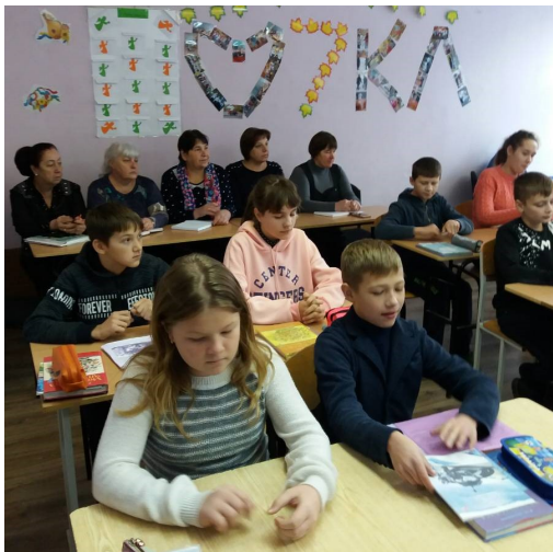
Відкритий урок української літератури в 7 класі Божківського НВК

Одна з дієвих колективних форм методичної роботи - творчі групи вчителів, які створюються з метою впровадження досягнень педагогічної науки і передового досвіду в навчально-виховний процес.