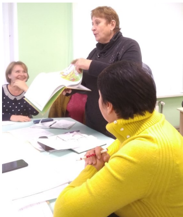
У ході творчої дискусії

Учасники заходу обговорили можливість використання тренінгів на уроках словесності та отримали методичні рекомендації з даної теми.