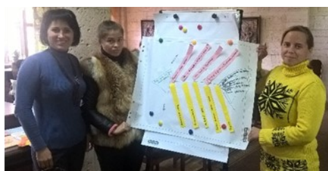
Рефлексія на здобуті знання

В умовах компетентнісної освіти оцінювання має спрямовуватися на розвиток учня, а не бути засобом покарання. "Ведіть дітей від успіху до успіху, від радості до радості" , — наголошував В. Сухомлинський. Такої ж позиції дотримується й Ш. Амонашвілі, замінивши червоне чорнило (колір помилки) на зелене (колір успіху): "Я шукав не помилки в учнівських роботах, а успіхи. Якщо хоч одне слово в реченні написано правильно, якщо хоч один математичний приклад вирішено правильно — це успіх. Я підкреслюю це зеленим: "Молодець! Я радий, я здивований! Захоплений тобою!"