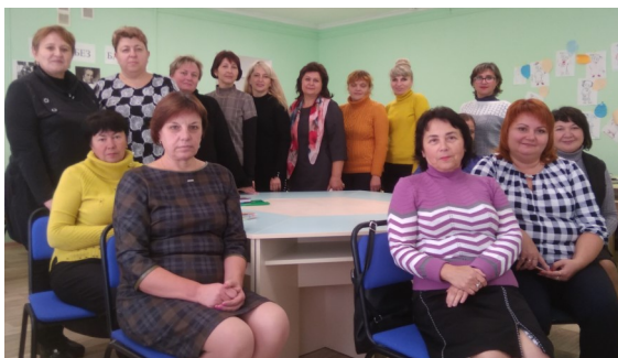
Учасники засідання авторської творчої майстерні